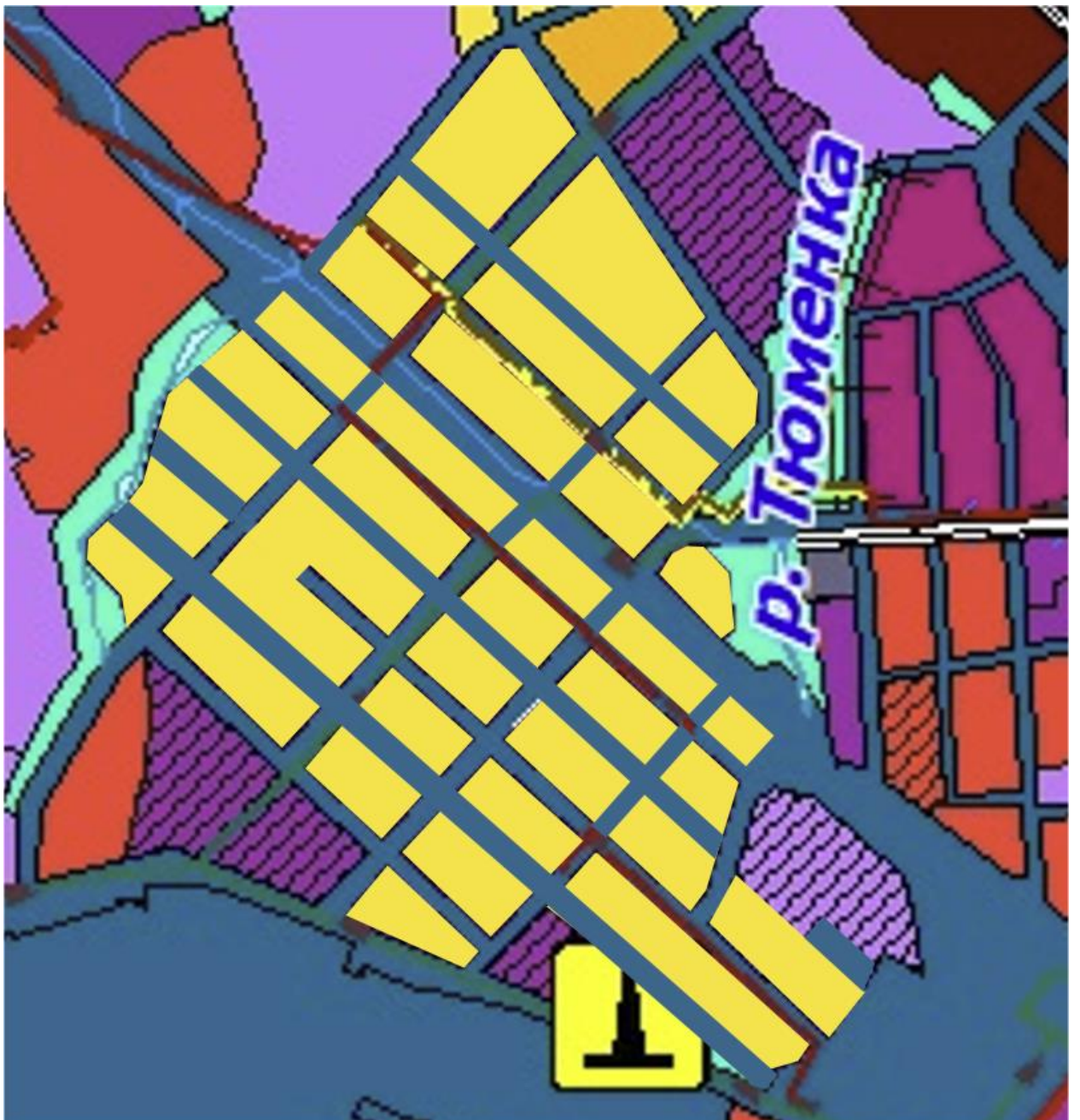
Приложение 2. Предлагаемые изменения Генерального плана г. Тюмени